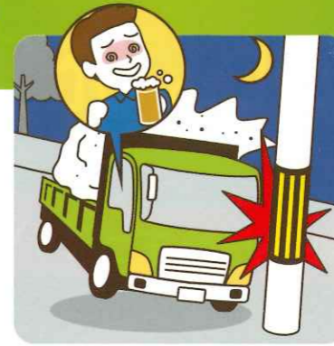
飲酒を伴う交通事故の実態(過去5年間)

飲酒運転は悪質な犯罪であるとの認識をしっかりと持ち、二日酔いを含めた飲酒運転の根絶を目指しましょう。「捕まらなければ大丈夫だ」という間違った考えをいませんか? 「飲酒したら運転しない」、「運転する人には飲ませない」を徹底しましょう。